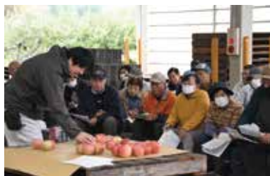
サンふじ出荷目揃い会 (若穂果実流通センター)

出荷に向けて各地区で１１月５日から１２日にかけて収穫出荷目揃い会を開き、収穫適期の判断や出荷基準について、見本果を見ながら確認しました。今年は高温干ばつの影響で例年より小玉傾向ですが、大きな病害はありませんでした。営農技術員は「１１月中の販売で単価を確保するため、食味・熟度を確認して１１月中に早めに多く出荷をしてほしい」と呼びかけました。