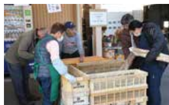
ナガイモを選ぶ来店者

家庭用ナガイモは人気で1人2袋までの数量制限がされましたが、半日で300袋ほどが販売されました。毎年、横浜から買いに来ているという夫婦は「家の方ではこんなに長い物は売っていない。友達にも喜ばれ楽しみにしている」と話し、ナガイモを選びました。