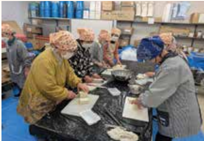
きのこ汁振る舞いの準備 (松代支部)