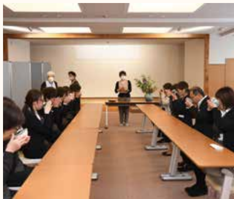
講師に作法を教わりながらお茶をいただく職員