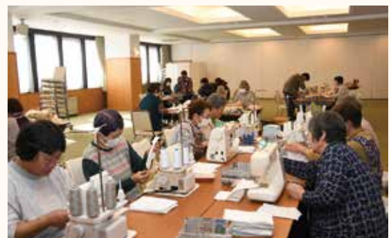
分担して作業する様子

衛生資材作りでは型紙に合わせて布を裁断する人、ミシンで縫う人に分かれ、新聞紙の箱作りも担当に分かれて作業をしました。このボランティア活動は長年続けている活動ですが、部員が集まり共同で作業することは昨年からは始まった取り組みです。部員同士教えあい、会話も楽しみながらできるボランティア活動で、部員は「手を動かしながらおしゃべりもするので脳トレにもなる!」と話し、会場は楽しそうな話し声や笑顔にあふれていました。