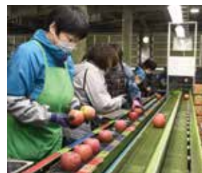
サンふじの選果 (西部青果物流通センター)