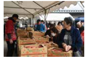
若穂地区JA祭&amp;ふじまつり