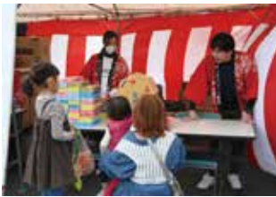
アグリしののいJA祭

JAでは10月から11月にかけて、組合員や地域のみなさまへの感謝を込めて各地区でJA祭を開きました。青壮年部、女性部が活躍。SBCラジオの公開生放送やJA共済アンバサダーによる地元農産物の消費拡大・宣伝活動も行われました。多くのみなさまにご来場いただき盛り上がりしました。ありがとうございました。