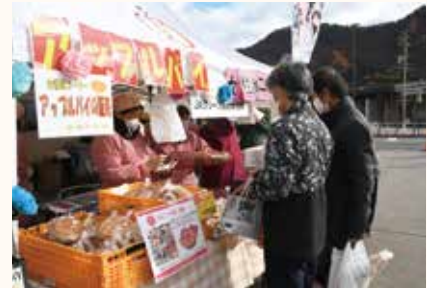
アップルパイやおやき等の販売 (若穂総支部)