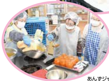
あんずジャム作り