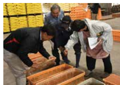
ナガイモの規格を確認する生産者と 営農技術員(左)

ナガイモは１０月２７日から集荷が始まりました。ＪＡ担当者は、「年内は贈答や地元の店舗、イベントでの販売を中心に取扱いしていく。家庭用の袋入りの需要が多くあり、運賃などの経費が抑えられ手取りが多くなる傾向にあるので、早めに出荷してほしい」と、目標に掲げる家庭用１万袋の販売、人気の県内外向け贈答品対応のためにもＪＡへの集荷を呼びかけました。