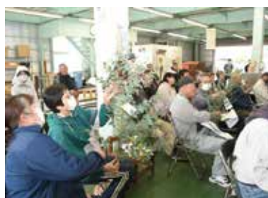
ユウカリを手に取り確認する生産者

販売担当者は、１１月中旬から年末にかけて需要が高いので、このタイミングで上位等級の長めのものを出荷してもらい安定した販売につなげたいと出荷を促しました。出荷規格について営農技術員は、情報を買手手に伝え、購入してもらいやすくし単価につなげるため、一つの箱の中には同一品種、同一規格のものを詰めて出荷するよう呼びかけました。参加者は見本のユウカリを手にとって、葉の大きさや枝の曲がり具合などを確認しました。ＪＡでは年間３５万本の販売目標を立て、関東を中心に中京、大阪方面へ販売していきます。