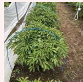
小トンネルをかけた園

ろうそくは市販されている12時間燃焼するものなどが効果的。ただし、資材がたるんでいる、また、茎葉がろうそくの上にある場合などは火災の危険があるため、資材の設置時に注意を払う。