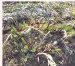
凍霜害対策を行わず、被害に遭った園地。ただし、生育が進んでいなかったため、出荷は見込める状態。

敷きわらをするとうちが上がりやすく、低温に遭った際に敷きわらがあると、被害が増える可能性があるため、敷きわらは、凍霜害の危険時期が過ぎてから行うこと。