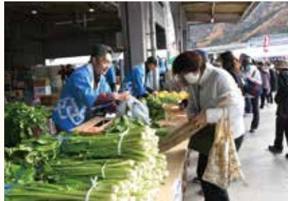
秋冬野菜の販売(若穂支部)