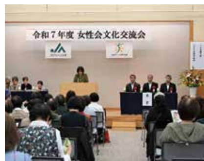
文化交流会の様子

また、当日200点以上集まったフードライブの食材は、11月5日(水)、米田会長から地元の福祉施設「YMCA サンホーム」へ寄贈されました。