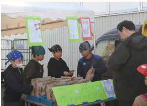
自慢のお米を販売する児童