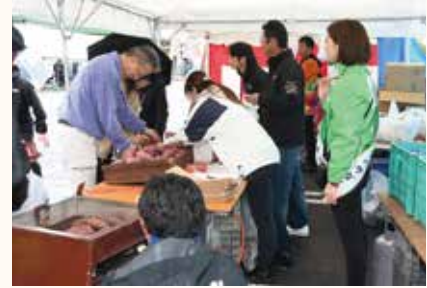
さつまいも詰め放題(篠ノ井支部)