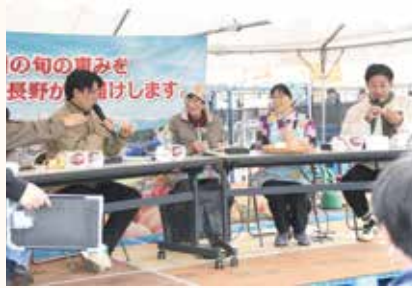
ラジオ公開生放送で女性部活動をPR (篠ノ井総支部)

青壮年部と女性部は10月、11月、各地区のJA祭・ふじ祭りに出店・参加しました。農産物・加工品の販売、宣伝活動で盛り上げました。