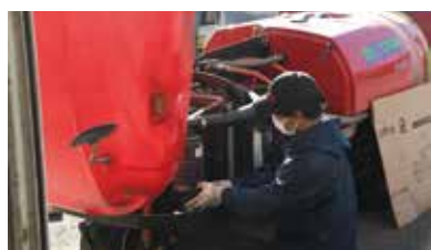
丁寧に点検する職員

農業機械センターでは１０月から１２月にかけて、各地区でスピードスプレーヤー整備会を開きました。毎年、地区ごとに整備会の日を決めて、春から秋にかけて使用したスピードスプレーヤーを来春に備えて整備をしています。各農業機械センター職員も応援に入り、ＪＡ職員とメーカー社員がその日に集中して点検を行いました。