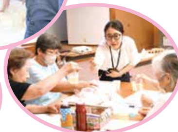
野菜作りのコツと裏ワザ講習