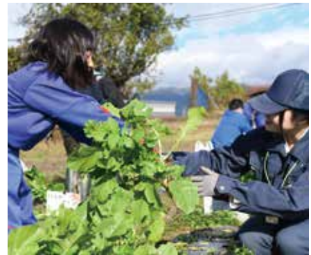
高校生と大根を収穫する児童

野菜はどの家庭も豊作、サツマイモ掘りは芋を傷つけないように高校生がスコップの使い方をアドバイスしました。その後、高校生主導でオリジナルのリース作りをしました。閉校式では児童ひとりずつに修了証が贈られ、児童は「いろんな野菜が作れてよかった」など感想を発表しました。高校生は「農業は暑い中など大変だけど、大きくたくさん収穫できたら頑張ってたかったと思う。そんなすてきなことを一緒にできて楽しかった。これからも農業を続けてほしい」と伝えました。