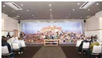
人形供養祭の様子

ＪＡと株式会社長野エコープサプライは１０月２６日、ＪＡ虹のホール篠ノ井で「人形供養祭」を執り行いました。組合員ら１６６組が訪れ、長年大切にしてきたぬいぐるみやひな人形、五月人形など約２６００体を持ち込み祭壇に飾り、地元の曹洞宗龍眼山円福寺の住職による読経で供養しました。