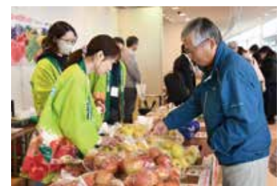
りんごを選ぶ来店者

グリーン長野産のりんご、ぶどう、きのこなどの農産物やジャムを販売、PRしました。開場前から多くの来場者が集まり、長野市産の農畜産物、農業への関心が寄せられていました。