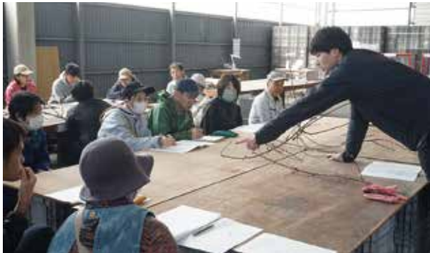
「芽」について枝を使って説明する営農技術員⑥

受講生の一人は「基礎から学びたいと思って参加した。初回からとても勉強になった」と感想を寄せました。