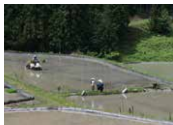
※応募時のご希望により、匿名(フォトネーム)にてご紹介します