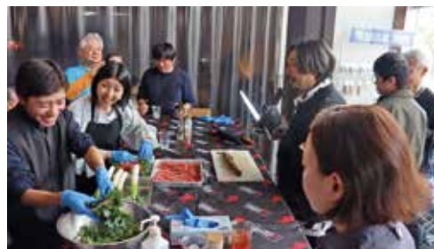
パーティを楽しむ参加者

当日はイベント全体で約50キログラムの近江牛を使用し、会場は香ばしい香りに包まれました。参加者からは「違いがよく分かった」「近江牛と地元野菜との相性が抜群」といった声が聞かれ、満足度の高い催しとなりました。同JAは今後も関係団体と連携し、近江牛の魅力発信と消費拡大につなげていく考えです。