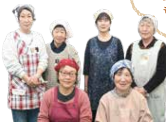
女性部川中島町総支部のみなさん

お肉とごはんといっしょに、レタスがたくさん食べられるメニューです。子どもにも大人にもおすすめです。