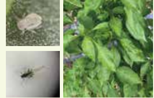
▲アブラムシの媒介によりウイルス病を発病

アブラムシは、有翅虫(羽あり)や無翅虫(翅なし)、体長は1～4ミリ程度、色は緑、黒、赤など、さまざまな種類がいる。特徴としては、単為生殖や有性生殖と繁殖力が旺盛。爆発的な増加もあり、繁殖は数世代～十数世代に渡る。