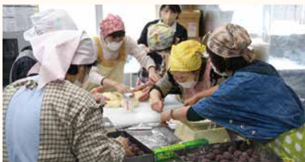
分担してパンを作る参加者