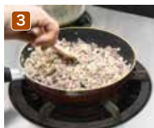
3 エノキダケからいいダシが出ておいしくなる。