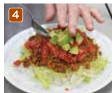
4 盛り付けの順は、ごはんの上にレタス、肉の順番でもよい。好きな盛り方で。