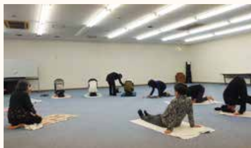
講師の指導で三点倒立

「生活文化教室」のひとつである「健康ヨガ」は4月1日に川中島ふれあいセンターで今年度最初の講座を開きました。講師を中心に新規受講生を含む9人が三点倒立の「あまのじゃくポーズ」に挑戦しました。このポーズは身体を逆さまにすることで下半身に溜まった老廃物を排出し、全身の血行を促進する働きがあります。講師によると、頭と内臓が下になることで脳への血流が促され、疲労回復やストレス解消にも効果が期待できるそうです。