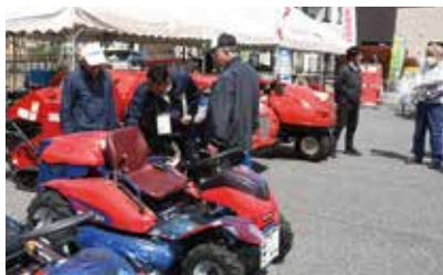
最新農機具の説明をする職員

農業機械センターは、4月17日・18日の2日間、篠ノ井のA・コープファーマーズ南長野店西側駐車場にて「春の農業機械統一展示相談会」を開きました。展示会では、小型機械から大型機械はもちろん、スマート農業機械紹介ブースや近年の高温干ばつ対策として最新かん水ポンプ、スプリンクラーなど約130台が展示されました。また、セルフメンテナンス・農業機械安全講習会も同時に開かれ、作業後のメンテナンス方法や安全に作業を行っていただくための注意事項を来場者に丁寧に説明しました。