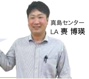
真島センター LA 梶博球

お問い合わせは各支所・ 共和センター・青木島センター・ 真島センターにて承っております。