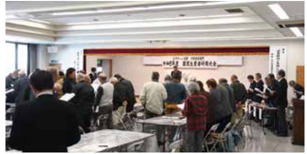
生産販売方針を唱和する生産者

川中島共選所運営委員会は4月3日、川中島共選所の平成ホールで「園芸生産者研修大会」を開きました。生産者70人と取引市場関係者が出席。昨年の市場情勢や実績を確認し、今年は、さらに生産者が一丸となり産地「グリーン長野ブランド」を全国へ届けていくことを目標の一つとして全員で確認しました。また、産地を守っていくためにも「担い手を地域のみinnで育て次世代へ」を合言葉に「川中島のもも」ブランドを守っていくことを合わせて確認しました。