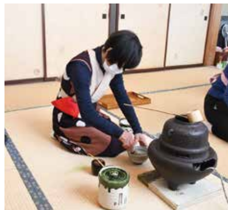
お茶を点てる会員

JAは、組合員・地域のみなさまに「くらしを楽しんでいただく」ことを目的とした、「生活文化教室」を開いています。その一つである茶道教室は、4月7日に今年度の開講式を開きました。現在は講師と会員4人で活動していますが、今回新たに入会を検討している方の参加があり、茶道についての基本的な説明を受けたあと、会員が点てたお茶を味わいました。教室で行っている茶道は、裏千家や表千家といった流派に属さない、奥田流といわれるものです。形式ばった堅苦しさがなく、今回初めて参加した方は「かしまっていないので気軽に習えそう」と話しました。