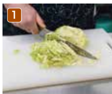
1 レタスは好みの太さの細切りに。好きな食感で。量も好みで増やして。