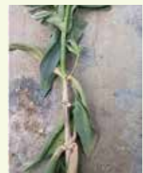
▲灰色かび病が発生したトルコギキョウ

春先から梅雨時期と、秋から初冬にかけて発生する。特に梅雨時期や秋雨時期において「低温」「多湿」などの条件が続くと発病しやすい。また、施設栽培の場合は暖房や換気によって湿度が高くなると4月以降でも発生する場合がある。(湿度が高く20℃前後の気温の時に発生しやすい。)