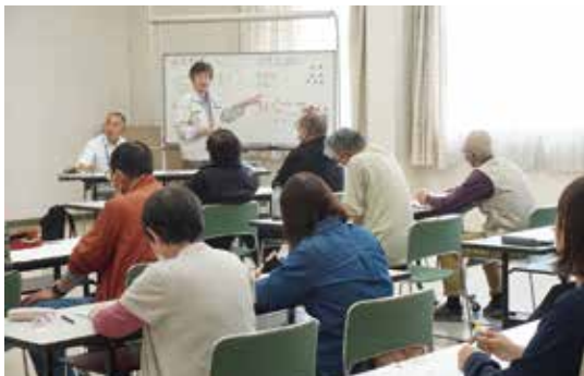
営農相談員が作業のポイントを伝授

受講生の一人は「なかなかうまく作れなかったので、教えてもらった内容を実践していきたい」と意気込みました。