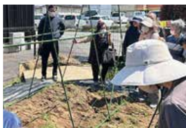
きゅうりネットの張り方を学ぶ参加者

JAファーム篠ノ井店で4月17日、「プロの仕上がり。風に負けない、きゅうりネットの張り方講座」を開きました。11人の参加者が集まり、今シーズンのきゅうり栽培に向け、ほ場で実習を行いました。同日、JAファーム松代店では「失敗しない！野菜苗の選び方講座」を開き、19人が参加。畑づくりから野菜苗の選び方のコツなどを営農技術員が講師になり学びました。