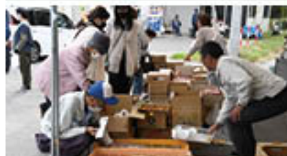
買い物を楽しむ来場者(10月26日)