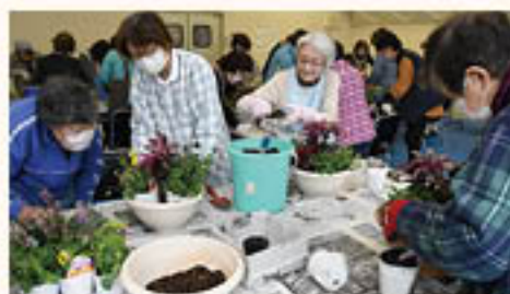
話をしながら寄せ植えを楽しむ