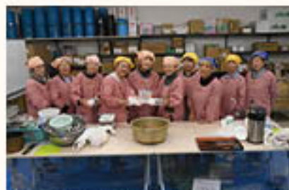
JA祭ですいとん・おにぎりづくり 注力した女性部松代支部