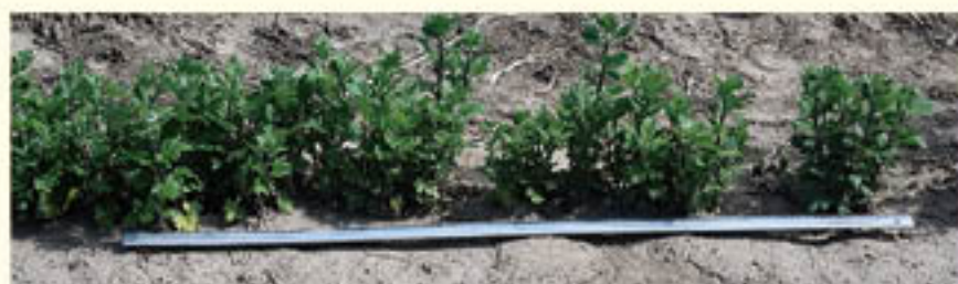
1mの間隔に80本が立ち本数の目安

間引きは、秀品率向上に向けた重要な作業。もったいないと思わず、必ず行うこと。特に前年の栽培において収穫物が細めで下位等級が多かった場合には間引きを行う。立ち本数が少ない場合は行わない。