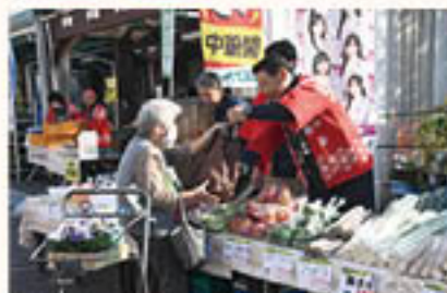
青壮年部松代支部がJA祭で農産物販売

青壮年部と女性部は11月中、それぞれ支部ごとに、JA祭やふじまつりに出店・協力し、農産物や農産物加工品の販売を通じて、イベントを盛り上げました。