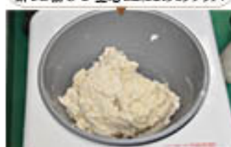
パン生地専用餅つき機