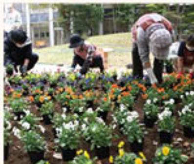
色とりどりの花を植えていく部員

花壇のテーマは、病院利用者や医療従事者などに届ける「癒しの波動」。女性部員は「とてもキレイに植えることができた。入院や通院が続いても、この花壇を見ていただくことで、少しでも心穏やかに過ごしてもらえたら嬉しい」と心を込めました。