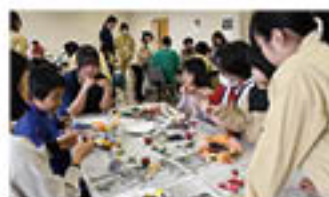
高校生が栽培した柿を使ってクリスマスリースづくり