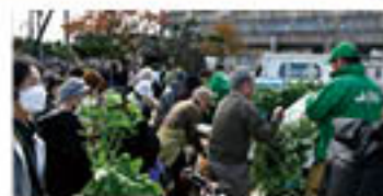
大盛況の地場野菜販売(西会場)

当日は、「健康百菜」(エコ農産物)の地元産野菜の販売に長蛇の列ができ、フランクフルトや焼きそばなど、各種模擬店では、JA役職員をはじめ各組織の組合員が手を携え、協同の力で祭りを盛り上げました。また、地域の保育園児による和太鼓の演奏や鼓笛隊、地元中学生の吹奏楽などのパフォーマンスや、女性会のフードライブで集めた食品の地元福祉施設への寄付などを通して、地域の人々とのつながりを深める農業祭となりました。