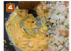
3 ③を端に寄せ、卵を炒ってから混ぜる。