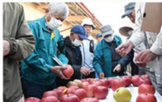
選果基準を確認する生産者

出荷に先立ち、11月5日から12日にかけて支部・地区ごとに講習会を開催。信更果実流通センター会場では、見本果実をもとに、選果の基準を共有しました。生産者は、「今年は虫の被害があって悔しいが、1個でも良いりんごを消費者に届けたい」と話しました。