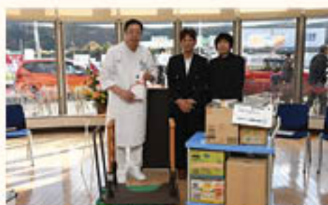
床置き型手すりを贈呈