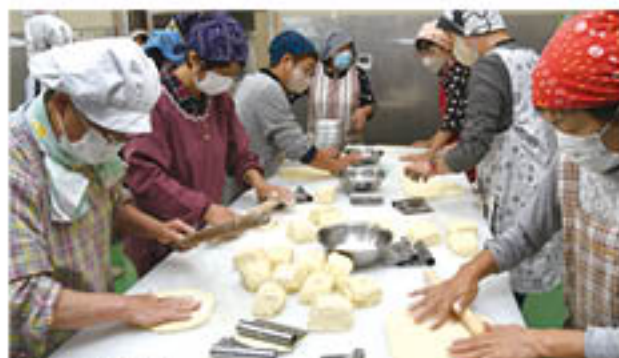
▲ 仲間と楽しく料理

オススメ 女性部員のグループなら利用料金が安くなる!! 女性部のみならずにより加工所をご利用いただけるよう、女性部加入者さまのみのグループは加工所利用料金を安く設定しています。女性部に未加入の組合員さまは、ぜひ女性部へのご加入をご検討ください。