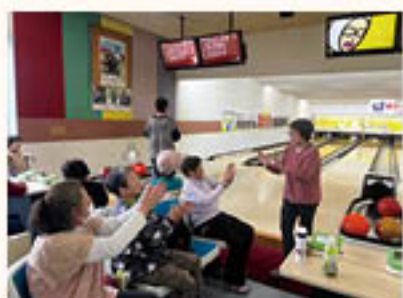
スベアに喜びハイタッチ！