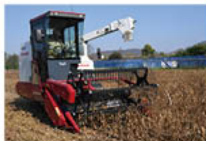
大型コンバインで収穫がすすむほ場

穀物部会員などのほ場で11月中旬、「大豆」の収穫が始まりました。大豆は農業法人や集落営農組織などにおいて、大規模に生産されるとともに、農地の遊休化防止としても導入される事例が多い品目。今年は、高温多雨の影響がありましたが、品質・数量を確保しながら約150トンの出荷を見込みます。