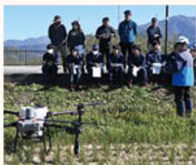
授業の様子を青壮年部員が見学