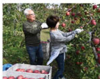
「楽しみにしてたんだよ」と夫婦で収穫