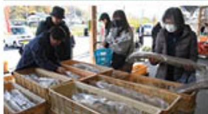
家庭用向けの袋入り品が人気(11月15日~)