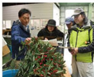
目揃会で品質を確認

花き部会花木専門部では、11月16日から「ユーフォルビア・フルゲンス」の出荷が始まりました。この花は当管内が国内の生産量の90%以上を占める「ここにしかない花」。20日に東部青果物流通センターで目揃会を開き、生産者3人が8万本の出荷をめざすことを共有しました。