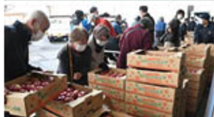
県内外から多くの人が訪れた会場(11月30日)