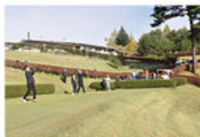
神農会長と栗林組合長による始球式