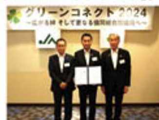
役員がグリーン」の絆を確認

JA名に「グリーン」の付く3JAの協定「グリーンコネク」は11月13日、滋賀県のグリーン近江管内で「グリーンコネク会議」を開きました。各JAの役員が出席し、「経営基盤強化に向けた今後の取り組み」について情報を共有。グリーンコネクの今後ますますの発展へ、「グリーン」の絆を確認しました。