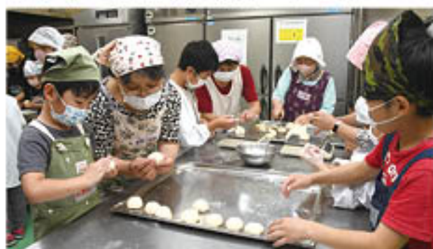
▲ 協力員が子どもたちへパン作りを指導

協力員に依頼をする場合には、加工所の利用申込みにあわせて、事前にご予約いただく必要があります。半日(1組)あたり1,000円の指導料が別途かかります。