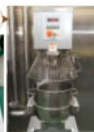
スタンドミキサー