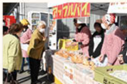
女性部若穂総支部がふじまつりで お菓子を販売