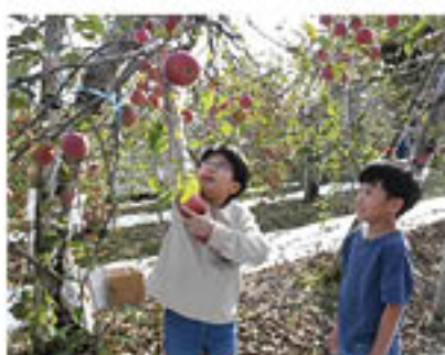
「高いところも届くよ!」と手を伸ばす子

JAと篠ノ井有旅の生産者による「有旅ビューりんごオーナー実行委員会」では11月16日・17日、「りんごオーナーの収穫日」を迎えました。全国各地のオーナーから78組・樹83本の予約を受け、この日まで園主が丹精込めて管理。オーナーは生産者に感謝を込めながら収穫作業を楽しんでいました。