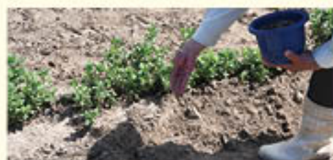
畝下(週路)に追肥する

追肥は、草丈が20cmの頃を見計らって行う。草丈が短めの時には少し待ち、7割程度が20cmを越えたタイミングを目安とする。基本的には、上記の施肥量を目安に、全ほ場で追肥する。ただし、生育が旺盛であったり、例年開花が遅れやすいほ場や品種(金元宝)では、減肥する。肥料は株元ではなく、畝下から週路に施す。(後に土寄せする。)