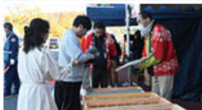
特設テントで農産物や菓子などを販売(11月16日・17日)