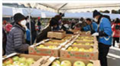
ズラリ! 家庭用向けりんご販売(11月23日)