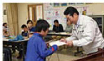
修了証を受け取る子

JAと更級農業高校が開く「親子ふれあい農業塾」は11月2日、今年度最後の講座を開きました。雨天で収穫作業を中止し、ワークショップと閉講式を行いました。閉講式では児童に修了証を贈り、受け取った児童が感想を発表しました。高校生代表は「農業は大変なこともあるけれど楽しいこともあり、一緒に体験ができて嬉しかった」と締めくくりました。