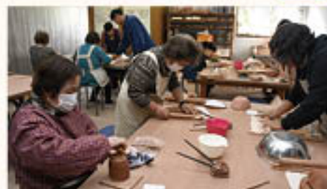
伸ばす・形を作るとそれぞれに作業をすすめる

仕上がったものは、乾燥・素焼・釉掛け・本焼きといった工程を経て完成する予定。部員は「どんな風にでき上がるかとても楽しみ」と心待ちにしていました。