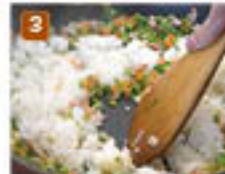
2 ご飯を加えたらヘラで押しつけて焼き、水分を飛ばす。