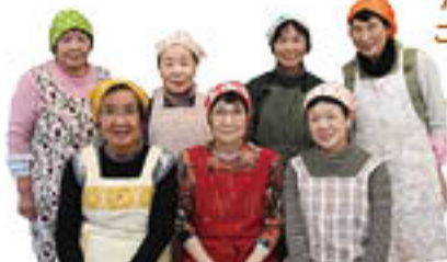
女性部員/井総支部のみなさん

彩りが良く、ニンニクのパンチが効いた味です。ご飯は温めてから炒めると良いでしょう。