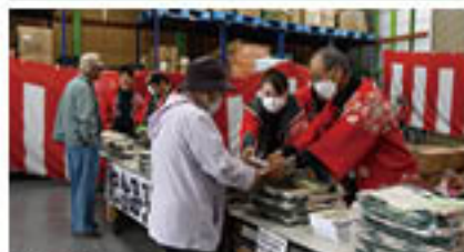
感謝を伝え記念品を贈呈(10月26日・27日)