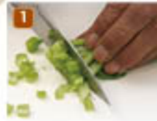
1 小松菜は細かく刻んだら、茎と葉を分けておく。