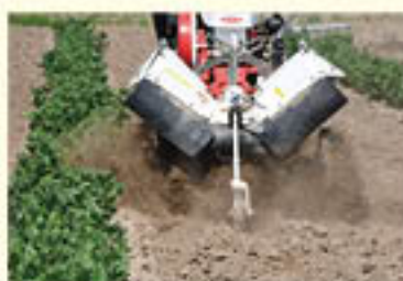
管理機による土寄せ

土寄せの方法は、コギクの株根を切るくらいの位置を目安に、管理機を使って土と追肥した肥料を攪拌(かくはん)し、株元に土を寄せる。管理機がない場合には、鍬を使う。いずれも株元にしっかり土がかかるようにする。