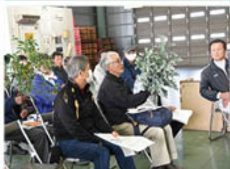
品種の特徴を確認する生産者

花き部会花木専門部で11月、「ユーカリ」の出荷が本格化しました。ユーカリは栽培管理が他の花に比べて容易で、花き栽培初心者にも向くとして、毎年新規生産者が増えている品目。今年は新規10人を含む83人が、35万本の出荷をめざしています。